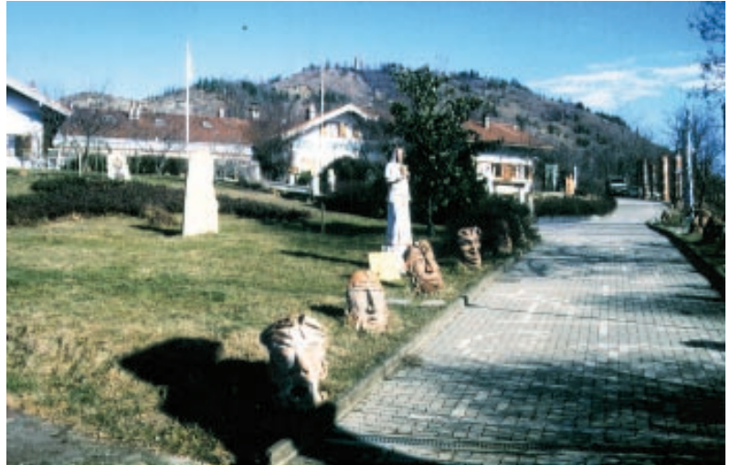
Eine Straße in Damanhur

ßen- und Schatzminister. Die Damanhurianer geben sich selbst einen Tiernamen oder einen Namen aus der Mythenvelt. Man sucht sich das Tier nach Sympathie und einem gewissem Bezug aus, der sich auch solchermaßen ausdrückt, daß man sich unter Umständen für diese Tierart engagiert. So trifft man hier also zum Beispiel den Gorilla, das Pferd (Cavallo), das Äffchen (Macaco), Kobra, Antilope oder Elf und Kobold.