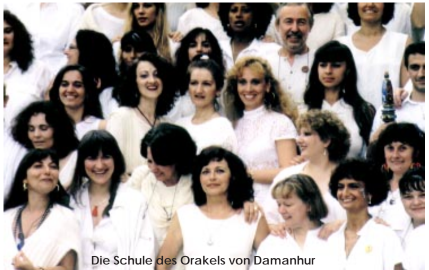
Die Schule des Orakels von Damanhur

Was gibt es für gemeinsame Rituale, Meditationen und Aktivitäten? Außer den Dingen die im Interview erwähnt sind, gibt es noch morgens eine kurze bewußte Einstimmung (individuell), eine Harmonisierung vor und mit dem Essen, und ein bewußtes Innehalten und Verbinden mit dem Ganzen bei Sonnenuntergang, das durch einen Gong angekündigt wird. Was mir auch gefallen hat, ist die Begrüßung der feinstofflichen Wesen und Naturgeister an einer durch ein Symbol (meist