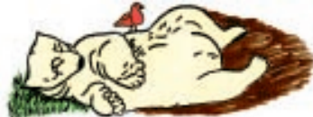
Die Bären-Meditation = chroooo, chrooo ...

Nein. Grundsätzlich gibt es den Meditationskurs, der einmal die Woche stattfindet, entsprechend dem Grad, und die jeweiligen Gruppen entscheiden, wann, wie oft und regelmäßig sie meditieren oder üben