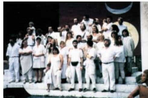
Die Schule des Orakels

Mittlerweile hat man auch einiges vorzuzeigen, was sich sehen lassen kann, z.B. die Weberei, die allerfeinsten Stoffe, wie Kaschmir, Seide und Kamelhaar, nach alten, vergessenen Methoden und Naturstoffen färbt und auf Webstühlen per Hand